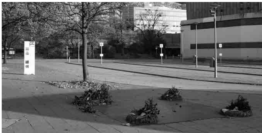
Der Vorplatz der Philharmonie mit der Bodenplatte, im Hintergrund die Informationstafel der Topographie des Terrors.