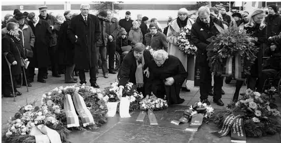
Gedenkfeier am 27. Januar 2012