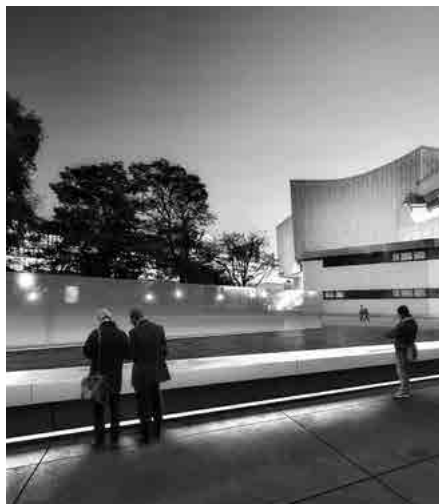
Blick nach Osten.