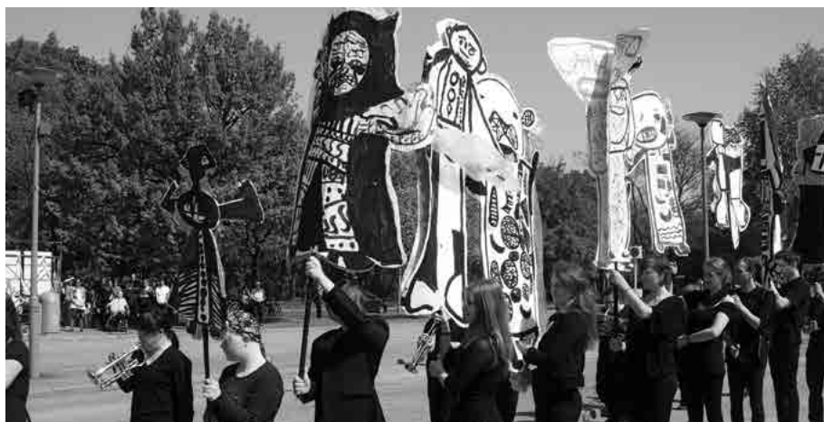
Eröffnung der Open- Air-Ausstellung mit der Gruppe Ramba Zamba.