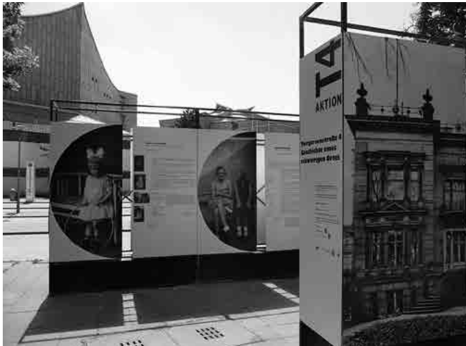
Open-Air-Ausstellung »Tiergartenstraße 4 – Geschichte eines schwierigen Ortes«. Auf der rechten Tafel ein Foto der histori- schen Villa.