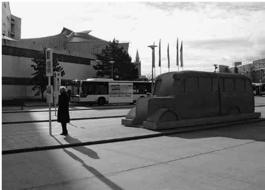
Das Denkmal der Grauen Busse vor der Philharmonie, 2008.

lassen – auf einer Kunstaussstellung vor dem Martin-Gropius-Bau gezeigt und zum Kauf angeboten. Der Philharmonie-Standort gefiel ihm besonders gut; er lobte die Korrespondenz zwischen den geschwungenen Formen seiner abstrakten Stahl-Skulptur und den architektonischen Schwingungen des Konzerthaus-Daches.