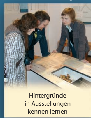
Hintergründe in Ausstellungen kennen lernen