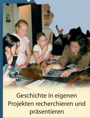
Geschichte in eigenen Projekten recherchieren und präsentieren