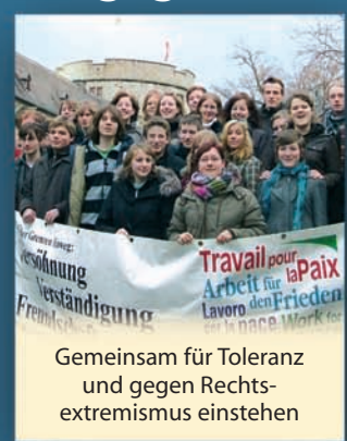
Gemeinsam für Toleranz und gegen Rechts-extremismus eintreten