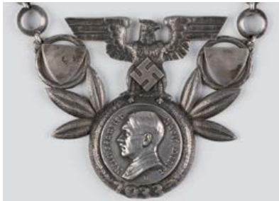
Anhänger der Kette des Frankfurter Oberbürgermeisters Friedrich Krebs von 1933