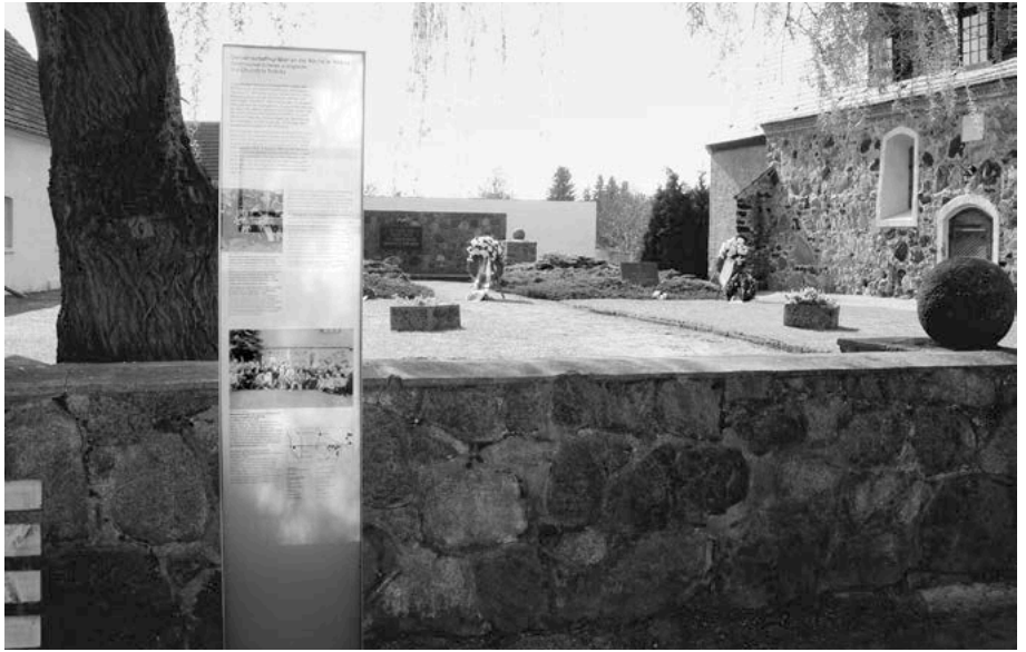
Neue Tafel vor der VN-Gedenkwand im Ortszentrum neben der Kirche.

Gedenkfeiern entstandene Netzwerk von Überlebenden und Familien. Die zentrale Ausstellung und ihre dezentralen Pendants wurden grafisch von Weidner Händle Atelier und architektonisch von Martin Bennis hervorragend gestaltet, als Balance zwischen einer thematisch sachlichen Darstellung und einer durch Layout und Lichtführung fast poetischen Anmutung.