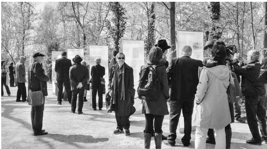
Ausstellungseröffnung mit vielen Besuchern.