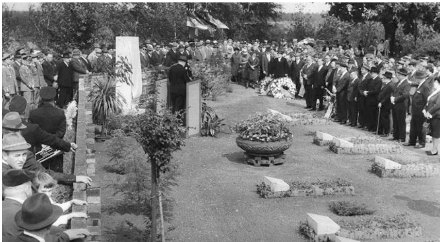
Einweihung des Friedhofs 1966.