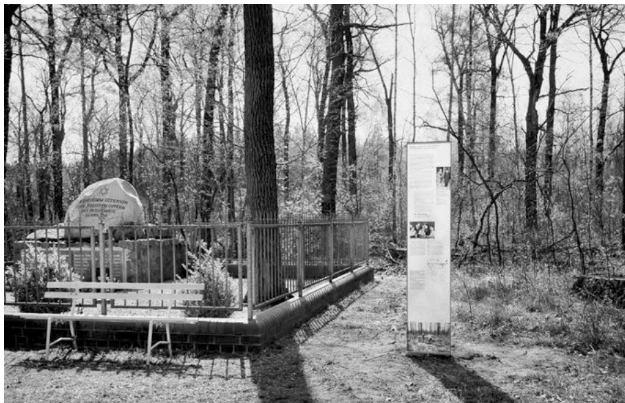
Denkmal am Bahngleis bei Langennauendorf mit neuer Informationstafel.

vorstellbare Situation. In einem ehemaligen Barackenlager für ukrainische Zwangsarbeiter, dem »Lager Nordfeld«, richtete man ein Notlazarett für die Typhuskranken ein und stellte den Ort unter Quarantäne.