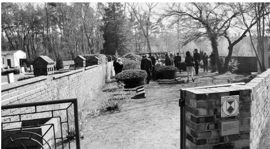
Jüdischer Friedhof, 2015.