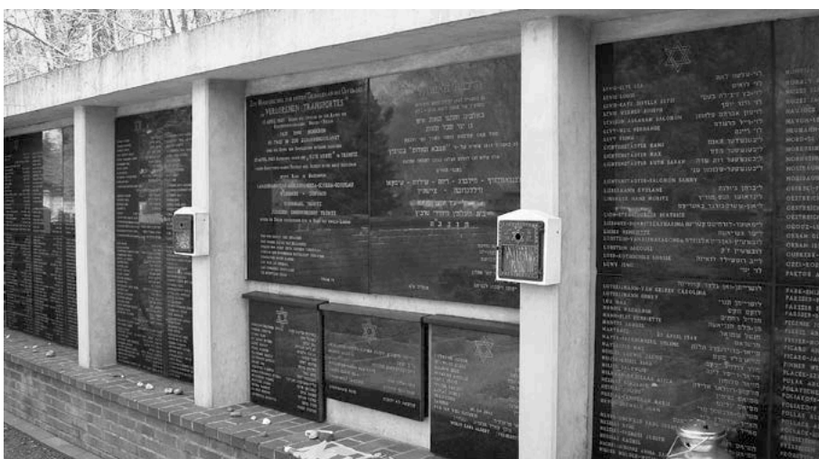
Gedenkwand auf dem Friedhof.