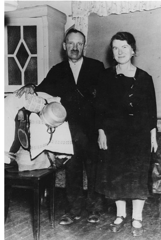
Kitzingen März 1942

An dieser Stelle sei angemerkt, dass die oben skizzierte visuelle Fehlstelle natürlich Auswirkungen auf die Präsentationen in Ausstellungen hat. Allerdings fehlen nicht nur Bilder. Die überlieferten Fotos von Männern und Frauen vor oder hinter einer Aktenablage, an runden oder eckigen Tischen, mit oder ohne Stift, Stempel, Schreibmaschine und Telefon sind prima vista keine aufregenden Fotomotive. Diese Fotos erlauben allenfalls Aufschlüsse