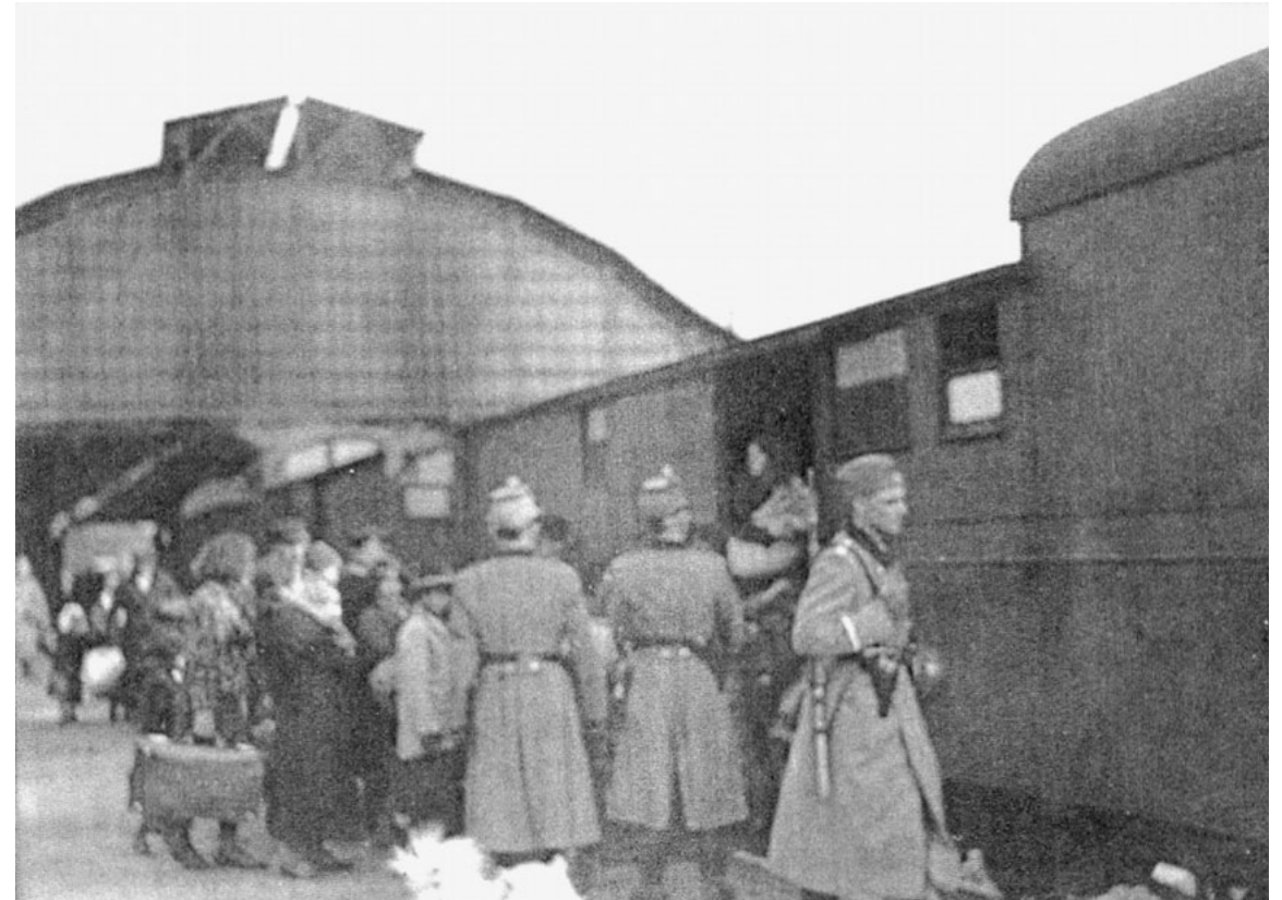
Remscheid, 3.3.1943

Die Serie aus Bielefeld belegt zudem eine inhaltliche Engführung des oben skizzierten, geläufigen Deportationsbildes. Die Deportationen aus dem Deutschen Reich wurden bis Mitte/Ende 1942 nicht in Güterwagen, sondern regelmäßig in regulären Waggonen der Dritten Klasse abgewickelt. Die im Bildatlas gesammelten Serien – Fotos aus Brandenburg, Dortmund (1938), Eisenach, Fulda, Hanau, Hattingen, Kitzingen, München, Wiesbaden und Würzburg – zeigen dies. Allerdings bricht unsere Überlieferung nach dem Sommer 1942 ab. Wir haben kaum Fotos der späteren Deportationen, insbesondere keine der besonders brutal durchgeführten sogenannten Fabrikaktion. Aus dem Jahr 1943 liegt uns bislang im Wesentlichen eine kleine Serie vor, welche die Deportation von über 200 als Sinti:zze und Rom:nja verfolgte Menschen aus Remscheid zeigt, die mit in einem Gepäckwagen der Reichspost deportiert wurden.