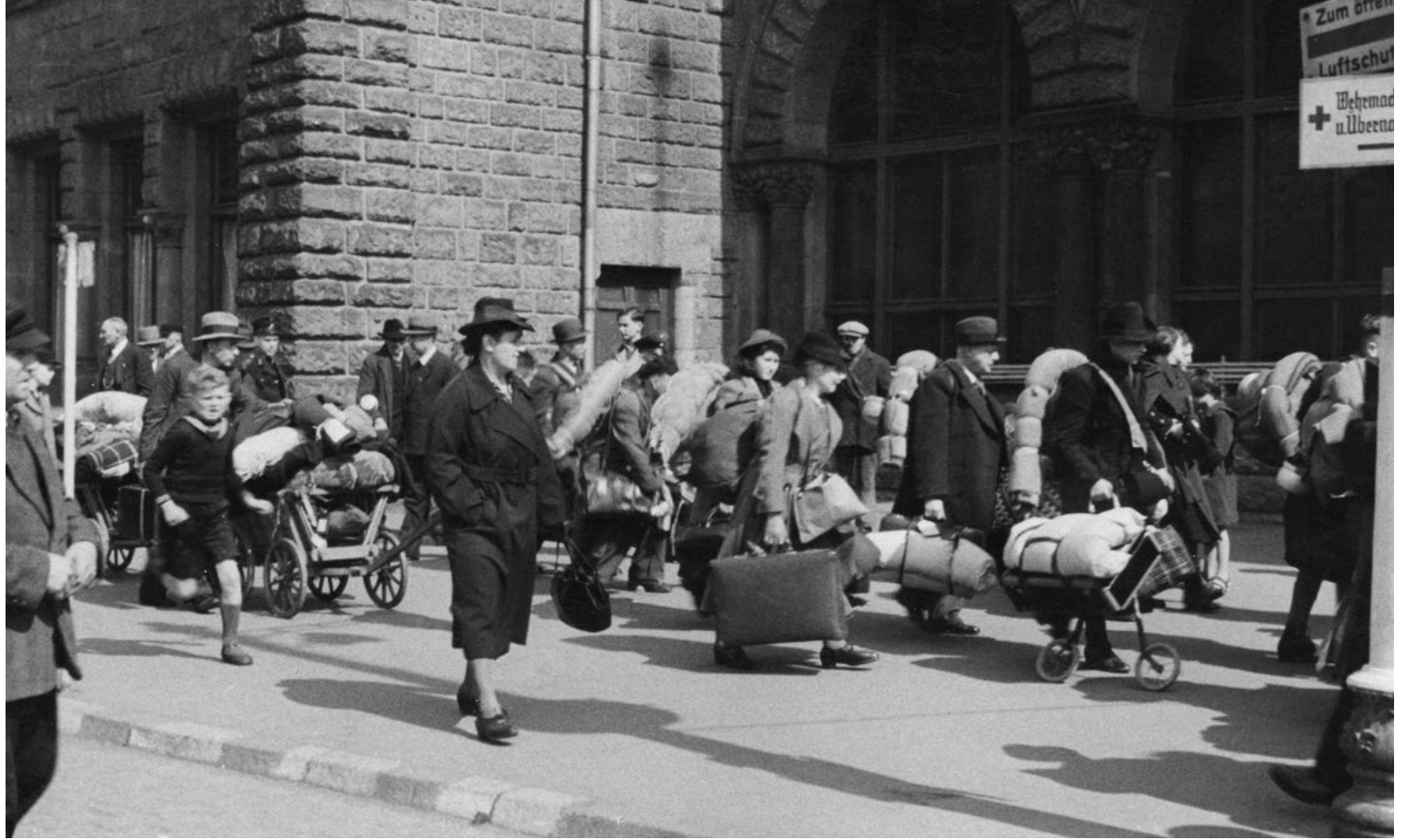
Eisenach 9.5.1942