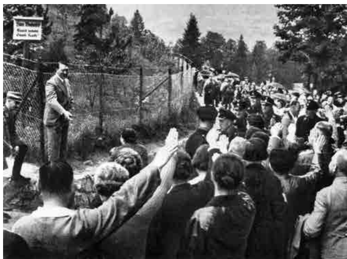
links: Hitler mit Wall- fahrern vor dem Haus Wachenfeld, 1934.