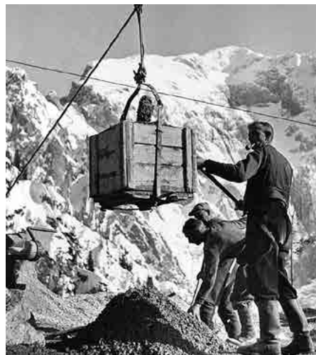
oben links und rechts: Baustelle der Kehlstein- straße.