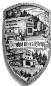
Stocknagel mit Berghof-Motiv, Mitte 1990er Jahre. Diese sind für 1 Euro immer noch erhältlich. Am Obersalzberg seit ein paar Jahren verschwunden.

Tatsächlich hatte der Obersalzberg in den folgenden Jahren die Funktion eines Machtzentrums des Deutschen Reiches und war neben der Reichskanzlei in Berlin Hitlers zweiter, nach Beginn des Zweiten Weltkriegs – neben den Führerhauptquartieren – dritter Regierungssitz. Hier empfing er wichtige Staatsgäste, Prominente und Würdenträger (Kurt Schuschnigg, Arthur Neville Chamberlain, Benito Mussolini, Leni Riefenstahl, Max Schmeling, Kardinal Michael Faulhaber u.a.). Alle politischen Themen einschließlich Staatsverbrechen wurden hier besprochen und in vielen Fällen auch entschieden, selbst wenn dies im Einzelfall nicht immer nachweisbar ist. 5