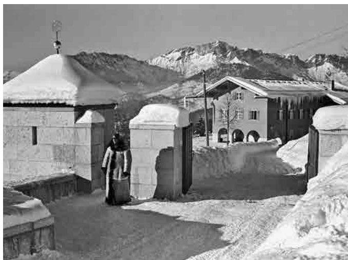
links: Posten vor innerstem Sperrgebiet. Im Hintergrund Gäste- haus Hoher Göll, auf dessen Grundmauern die Dokumentation Obersalzber errichtet wurde.