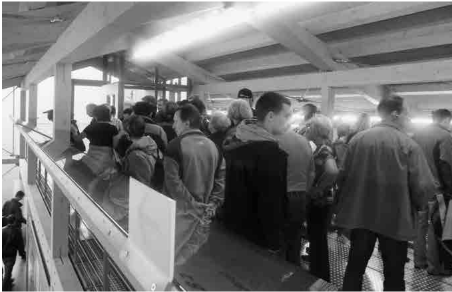
Dokumentation Obersalzberg, Galerie, Sommer 2010.

Träger der Einrichtung ist die oben erwähnte Berchtesgadener Landesstiftung. Für die wissenschaftliche und fachliche Betreuung ist das IfZ zuständig, wobei die museums-pädagogischen Mitarbeiter vor Ort residieren und die fachliche Leitung in München. Für den laufenden Betrieb verantwortlich ist der Zweckverband Tourismusregion Berchtesgaden-Königssee, den Unterhalt des Hauses trägt das Bayerische Staatsministerium der Finanzen. Der kaum zu überblickende Kreis an Beteiligten mit einer Vielzahl an verschiedenen Zuständigkeiten führt immer wieder zu Abstimmungsproblemen. In der für die Bildungsarbeit der KZ-Gedenkstätten innerhalb des Bayerischen Staatsministeriums für Unterricht und Kultus seit 1997 zuständigen Landeszentrale für politische Bildungsarbeit wird die Einrichtung nicht einbezogen. Auf ihrer Webseite und in ihren vorzüglichen Publikationen zum Thema Nationalsozialismus gibt es bisher keinen Hinweis dazu, obwohl die Dokumentation Obersalzberg dafür ein äußerst attraktiver Multiplikator wäre. 30