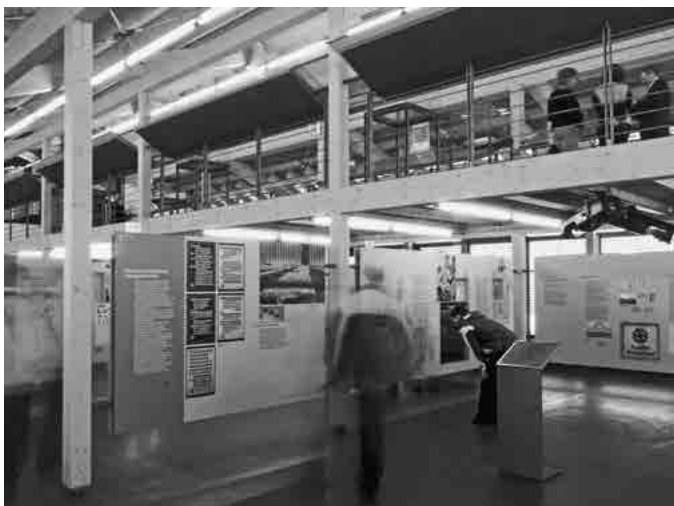
links: Dokumentation Obersalzberg, Gebäude und Ausstellung.