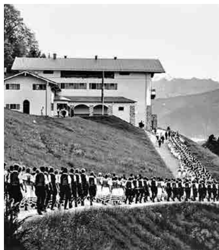
NS-Jungbauern als Wallfahrer 1937.