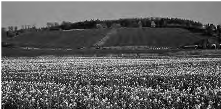
Auf dem gut erhaltenen riesigen Festplatz zeichnet sich bis heute der Mittelweg deutlich ab. Im Blick von unten zeigt sich die Längsausdehnung des Platzes extrem verkürzt.