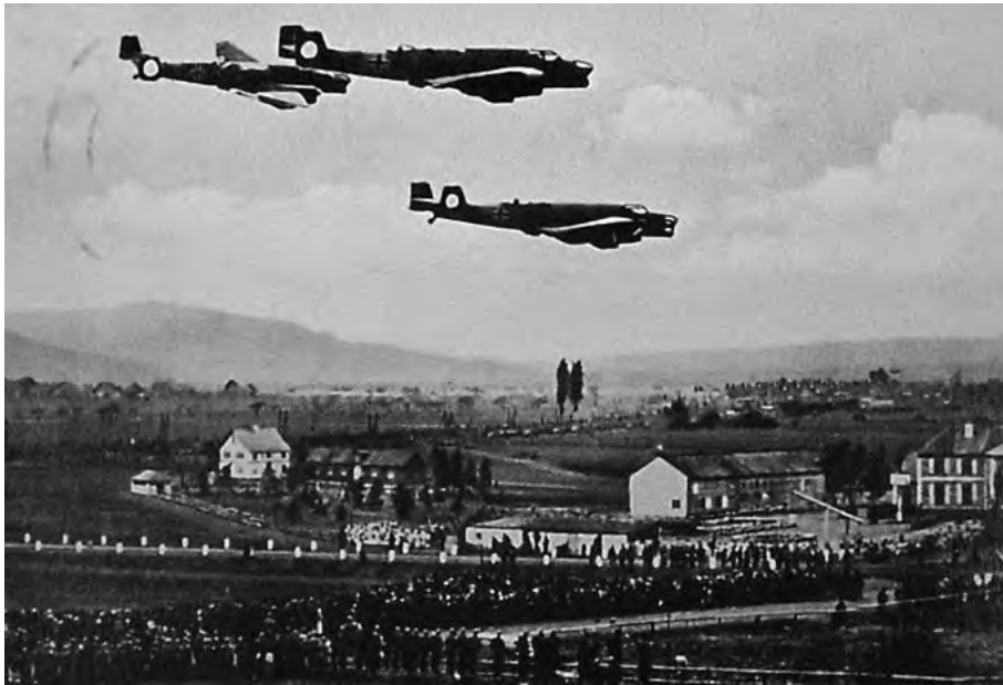
Bombenflugzeuge über dem »Bückedorf«. Von Beginn an, verstärkt aber seit 1935, prägen das Fest große »Schauübungen der Wehrmacht«. Postkarte von 1937

haben ergeben, dass unter den Teilnehmern des Festes Bauern und Parteimitglieder in der Minderheit waren. 9