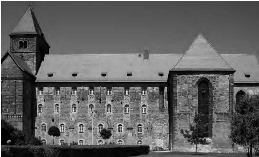
Die ehemalige Klosterkirche Breitenau, die im Mittelschiff als Haftstätte und im Ostteil (rechts) als evangelische Gemeindekirche genutzt wurde.

spiegeln. Dies alles fand sie so eindrucksvoll und bedeutsam, dass sie möglichst alle Künstlerinnen und Künstler im Vorfeld der dOCUMENTA (13) einmal nach Breitenau führen wollte, um diese dadurch vielleicht auch zu Kunstprojekten anzuregen.