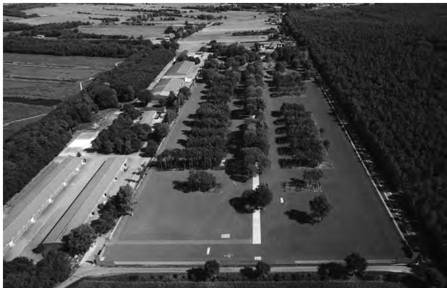
Gedenkstätte Esterwegen: Besucherinformationszentrum (hinten links) in zwei Bestandshallen aus den 1970er-Jahren und ehemaliges Lagergelände mit landschaftsarchitektonischer Visualisierung der Lagertopographie im früheren Häftlingslager (vorne).

Prof. Dr. Joachim Wolschke-Bulmann im Rahmen eines Workshops 2005 anregende und interessante Gestaltungsentwürfe, die in die spätere Aufgabenstellung für das Ideenfindungsverfahren zur Gestaltung des Außengeländes einfließen.