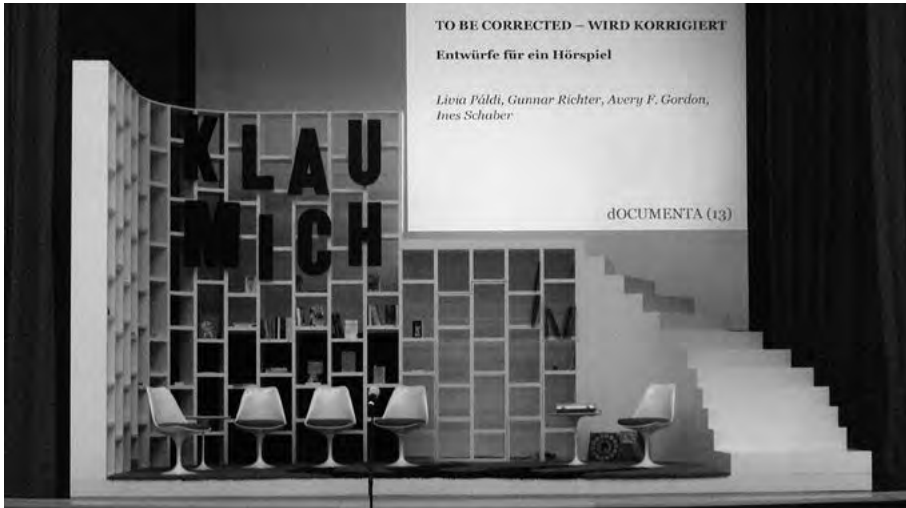
Die Präsentation des Hörspiels von Livia Paldi im Ständehaus.