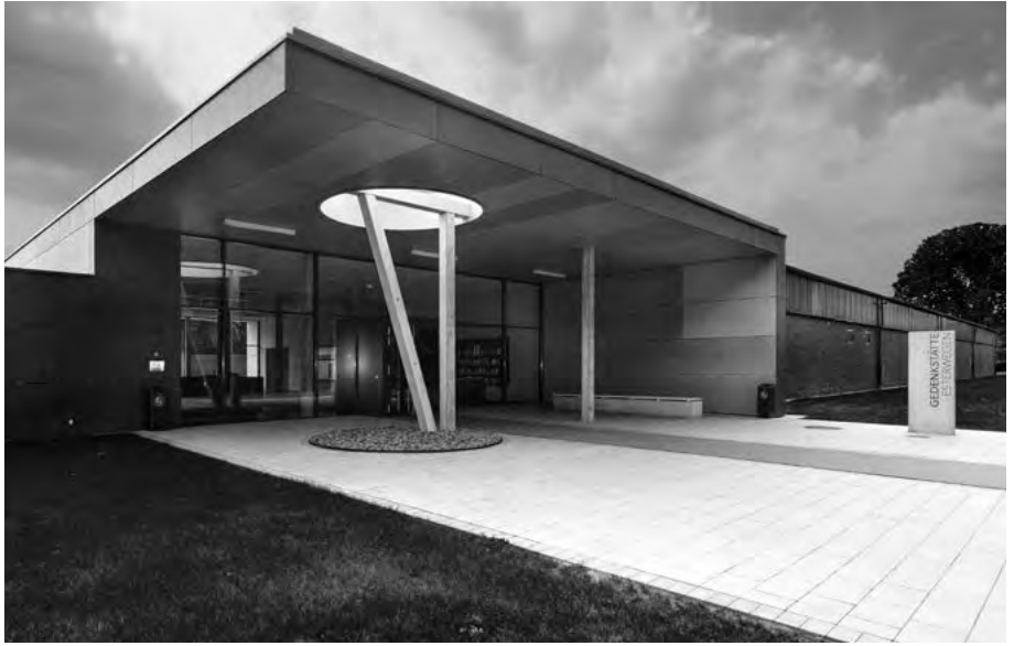
Das Foyer der Gedenkstätte Esterwegen.

Mit Beginn des Zweiten Weltkriegs ließ die Justiz zunehmend und spätestens ab 1942 in überwiegender Zahl Männer, die als Soldaten von deutschen Wehrmichtsgerichten zu Haftstrafen verurteilt und für »wehrunwürdig« erklärt worden waren, in die sechs nördlichen Emslandlager einweisen. Zu ihnen gehörten u.a. auch Zwangsrekrutierte aus Luxemburg, dem Elsass und Lothringen.