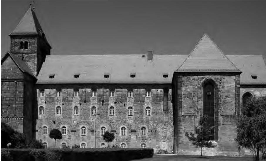
Die ehemalige Klosterkirche Breitenau, die im Mittelschiff als Haftstätte und im Ostteil (rechts) als evangelische Gemeindekirche genutzt wurde.

spiegeln. Dies alles fand sie so eindrucksvoll und bedeutsam, dass sie möglichst alle Künstlerinnen und Künstler im Vorfeld der dOCUMENTA (13) einmal nach Breitenau führen wollte, um diese dadurch vielleicht auch zu Kunstprojekten anzuregen.