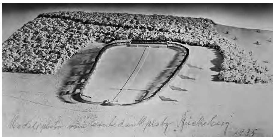
Modell des »Reichstingplatzes« Bückeburg nach dem Entwurf von Albert Speer aus dem Jahre 1934. Die Teilnehmer des Festes betreten den Platz über mächtige Treppen, die sich seitlich des Festplatzes befinden.