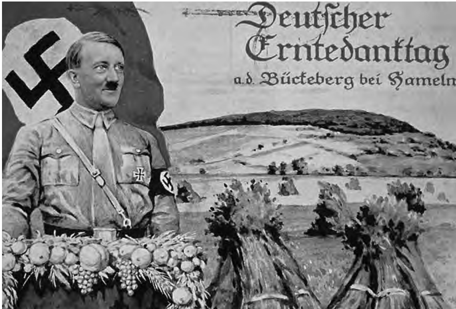
Der »Führer« als Freund der Bauern. Kitschige Idylle prägt die Schauseite des Festes. Postkarte undatiert, Sammlung Gelderblom

wurden. Als Kampfplatz diente das eigens errichtete »Bückedorf«. 1937 gab es ein realistisch inszeniertes Gefecht mit dem Einsatz von über 10 000 Mann. Tanks und Bombenflugzeuge kamen zum Einsatz, eine Weserbrücke wurde von den Fliegern vernichtet; das von Pionieren aus Holzlatten und großen Tüchern errichtete »Bückedorf« ging im Feuer der Artillerie in Flammen auf. Die Idylle des Erntebrauchs erstarb im Rasseln der Panzerketten. Die heimische Zeitung sprach schon fast hellseherisch von der »Schlacht der Zukunft«. 18