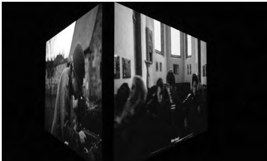
Der Film »Muster« von Clemens von Wedemeyer