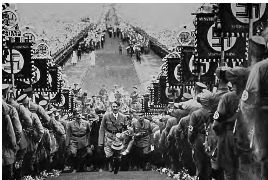
Der »Führer« besteigt die »Rednerkanzel«. Nach Abschluss der großen »Schauübung der Wehrmacht« sah das Programm als Krönung und Abschluss die Ansprache Hitlers vor. Postkarte, Sammlung Gelderblom